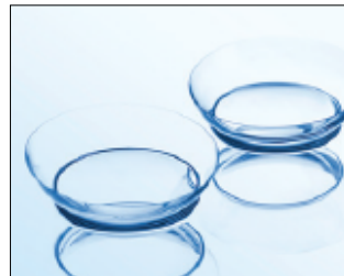
При правильном положении линзы она напоминает по форме «чашечку», ее края направлены вверх.